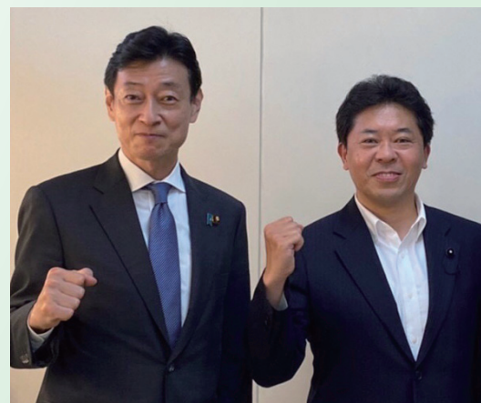
弁士/西村康稔 経済産業大臣 (3/26 魚住・大久保のみ)他