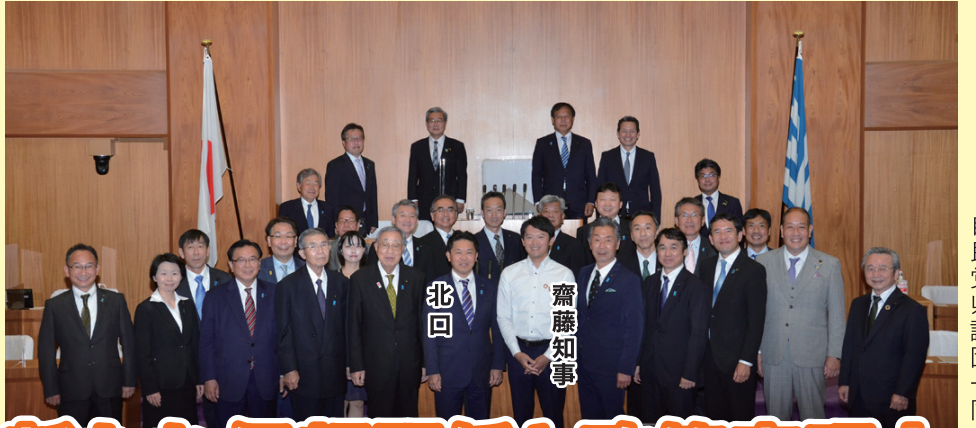
自民党県議団一同